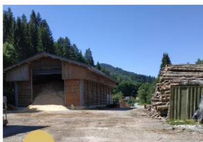
Secteur industriel et exploitation