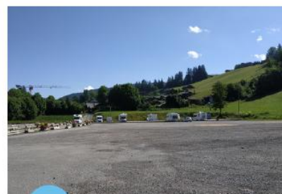
Parking des Perrières