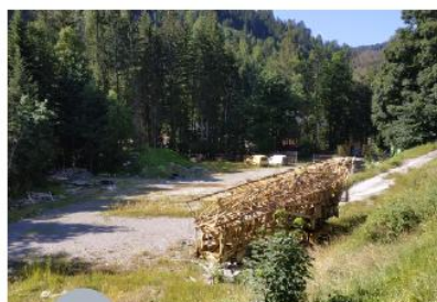
Décharge de matériaux et véhicules