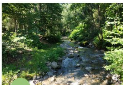
Secteur «naturel» forestier